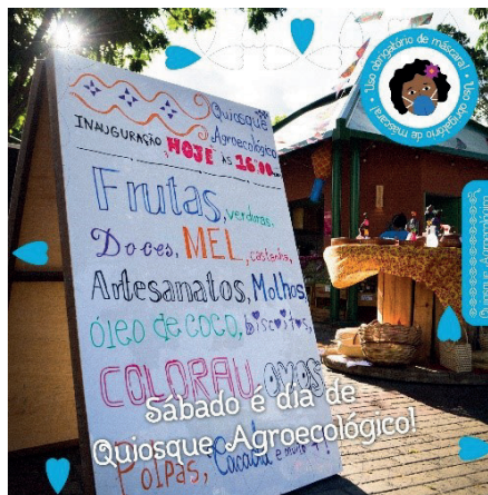
Kiosco Agroecológico funcionando – 25 de junio del 2021.