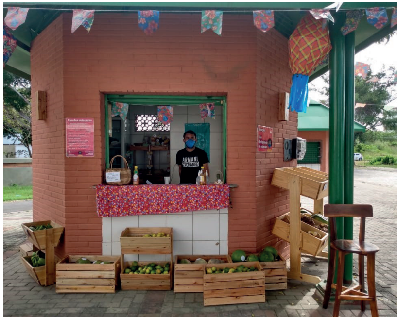
Kiosco Agroecológico funcionando – 25 de junio del 2021.