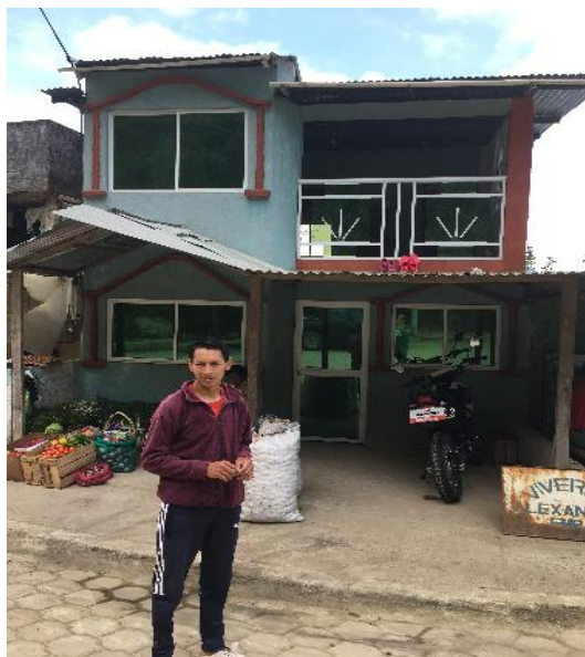
Foto 3. Casa del Productor

El estado de las vías es un gran problema para los productores de esa zona, ya que por más que tengan un buen producto, el mal estado de los caminos, hace que tome entre 7 a 8 horas cubrir la distancia que existe con las ciudades, que representan sus principales mercados, a la vez que reduce la calidad de la fruta y aumenta el costo del flete, más aún por lo complejo del terreno que deben atravesar, situación que se agrava en el invierno debido a la intensidad de las lluvias y el nulo mantenimiento a los viales.