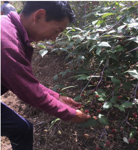
Foto 7. Cosecha de mora