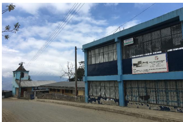
Foto 6. Escuela Jaime Roldós de la Parroquia El Empalme