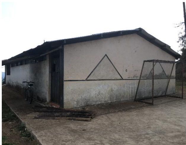
Foto 18: Sede social de las reuniones de productores de El Empalme

Los productores del recinto El Empalme cuentan con una sede para sus reuniones, infraestructura que fue provista años atrás por el Banco Mundial al igual que equipamiento, cuanto intentó fomentar la producción de pulpa de fruta, pero el mismo no fue utilizado, ya que no tenían mercado.