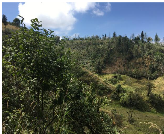
Foto 9: Don César Ortega (padre)Foto 10: Ubicación del solar de mora