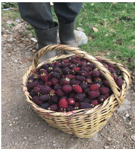
Foto 8. Cosecha de mora

Desde el punto de vista de los ingresos provenientes exclusivamente de la mora, el per cápita diario es de 4.27 USD; en otros productores es algo menor por su menor productividad y en otros algo superior al complementarse con ingresos en fréjol y derivados de la caña de azúcar, pero esa diversificación resta superficie a la mora. En todo caso no se trata de campesinos en situación de pobreza o de pobreza extrema sino más bien vulnerables a ella.