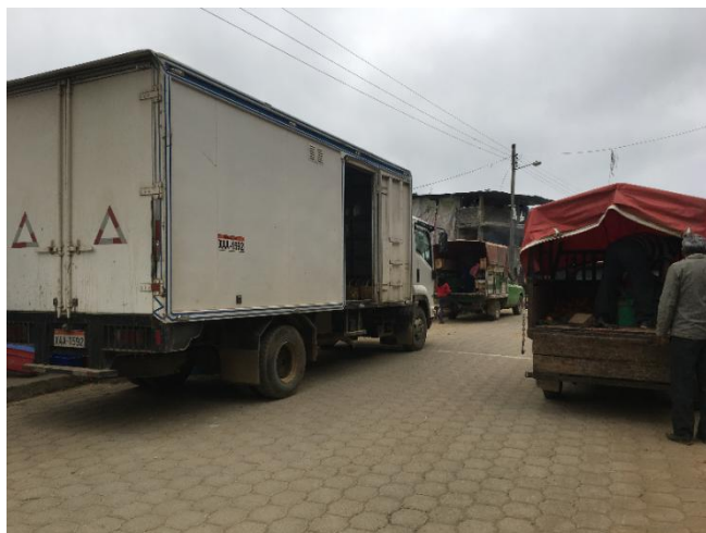
Foto 5. Camiones de intermediarios en El Empalme

Aunque las condiciones de vida de la vivienda se corresponden a una clase media rural, esto obedece a que existen dos ingresos, uno no agrícola; si fuera solo por el ingreso exclusivo de la mora la situación no fuese la misma.