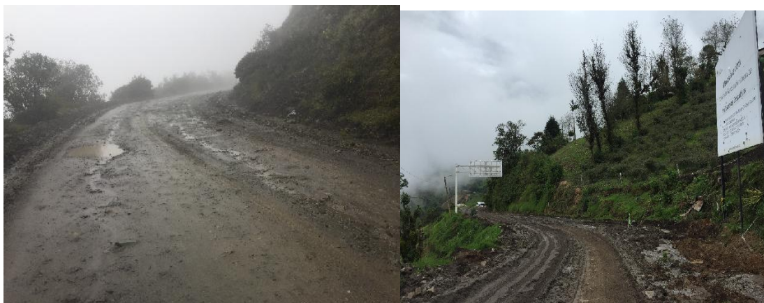
Foto 4. Carreteras de acceso a Pangua

El estado de las vías es un gran problema para los productores de esa zona, ya que por más que tengan un buen producto, el mal estado de los caminos, hace que tome entre 7 a 8 horas cubrir la distancia que existe con las ciudades, que representan sus principales mercados, a la vez que reduce la calidad de la fruta y aumenta el costo del flete, más aún por lo complejo del terreno que deben atravesar, situación que se agrava en el invierno debido a la intensidad de las lluvias y el nulo mantenimiento a los viales.