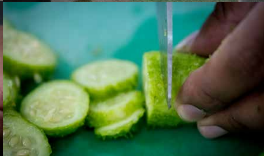
aulas práticas SENAC Aracaju | ingredientes, corte, montagem e apresentação