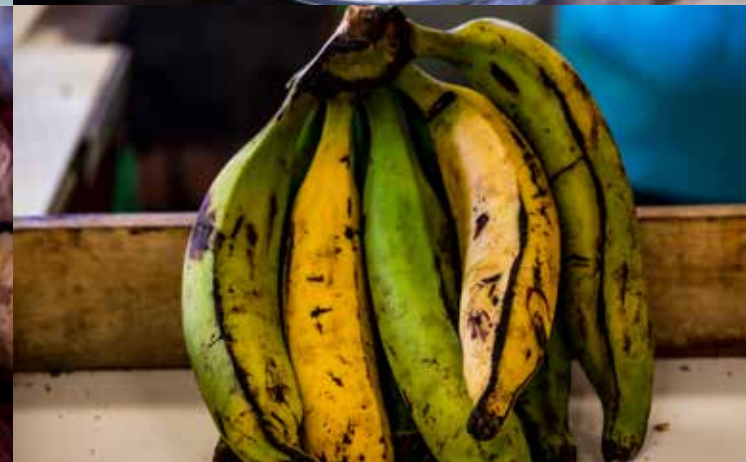
aulas práticas | visita ao Mercado Municipal Antônio Franco | Aracaju - SE