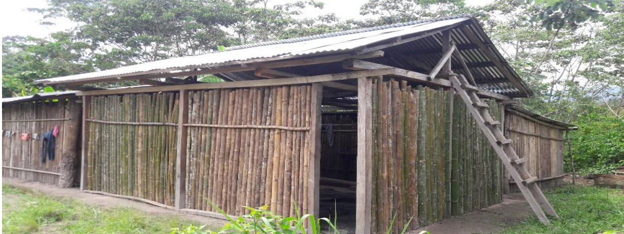
Fotografía N° 2. Construcción rústica con “marona” en el centro poblado de Bella Selva, (Moyobamba)