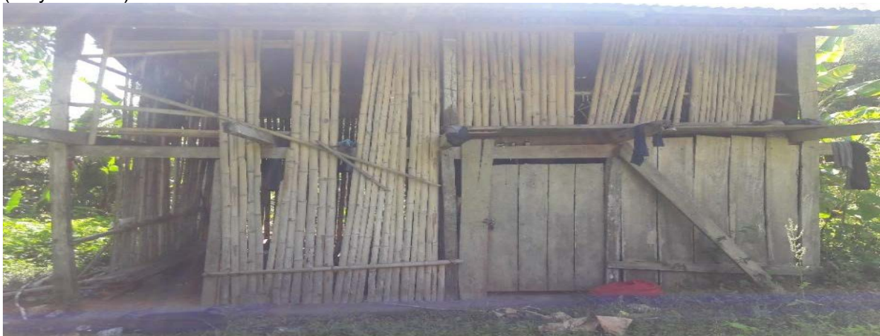
Fotografía N° 3. Culmos y brotes de “marona” en la comunidad nativa de Yara