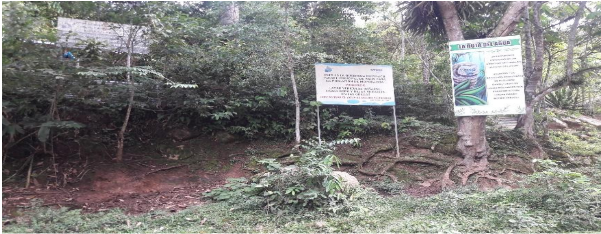
Fotografía N° 7. Culmos de Guadua aff. angustifolia en la plantación del fundo la reserva, Villarica