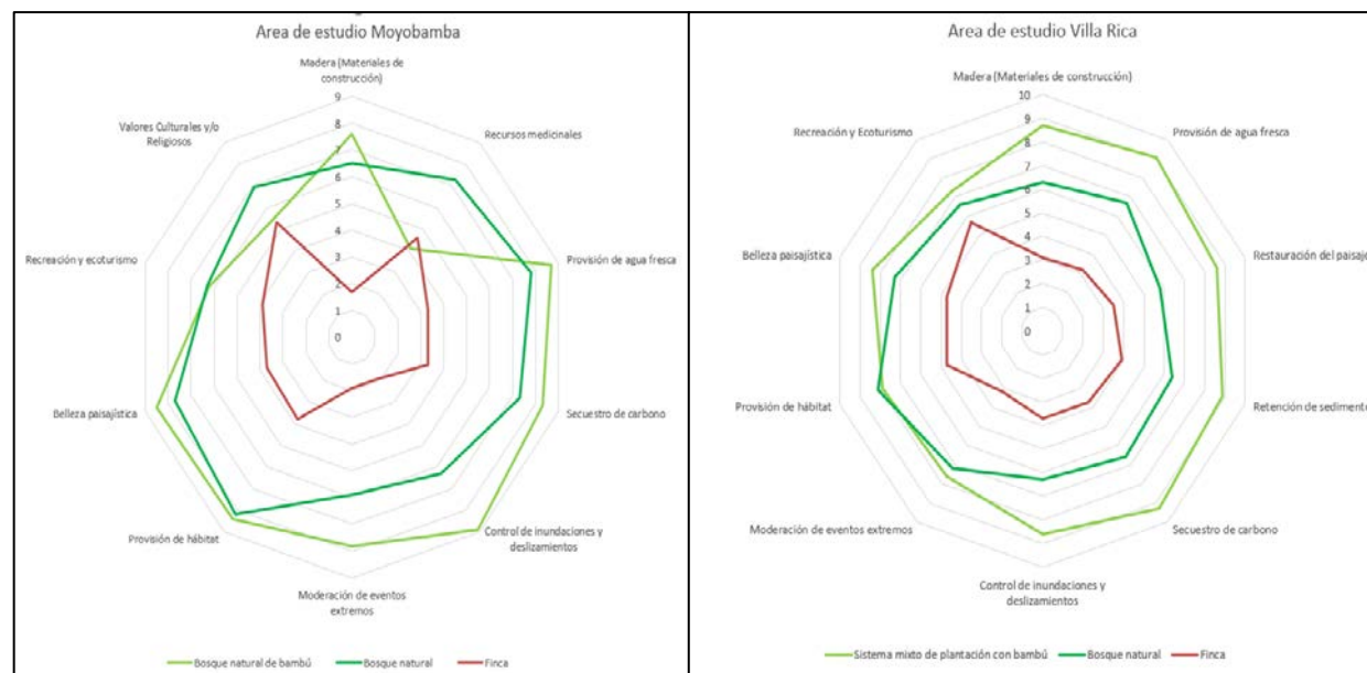
Figura 2. Análisis comparativo del enfoque de los SE en las áreas de estudio

En el área de estudio de Moyobamba, entre los SE proporcionados por los tres usos del suelo, el bosque natural con bambú destaca por sus servicios regulatorios en comparación con los otros dos usos del suelo. El bosque natural es más valorado por la biodiversidad (provisión de hábitat y recursos medicinales), que está vinculado a valores culturales y religiosos.