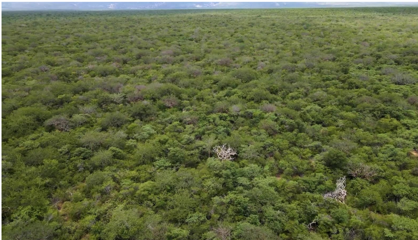
Imagen 3 Vista aérea de la zona de recaatingamento conservada.

para que las familias de las comunidades tradicionales con propiedad comunitaria permanezcan en el campo y se desarrollen de forma sostenible.