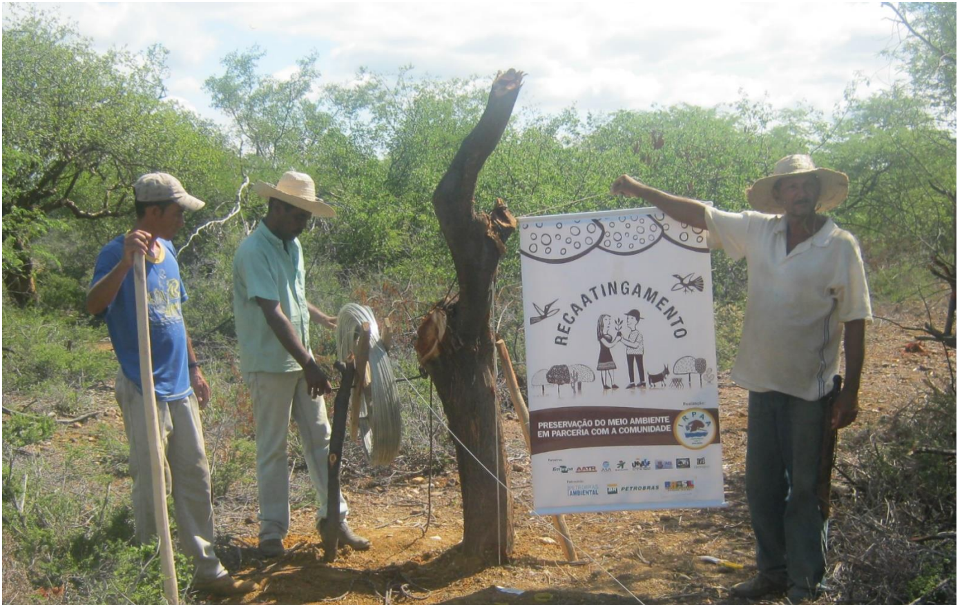
Imagen 2 Empiezo del recaatingamento en la comunidad.

1. Recuperación de la Caatinga: se realizó con el aislamiento del área identificada como la más degradada dentro del espacio colectivo de propiedad comunitaria, mediante el cercado, para impedir la entrada de animales. Las cercas en Fartura se realizaron con estacas de madera y cinco hilos de alambre liso electrificados con energía solar abastecida por panel solar, electrificador y batería. Se adoptó la propuesta de energía solar como experimento, con el objetivo de reducir costos en la construcción de las cercas para aislar grandes áreas.