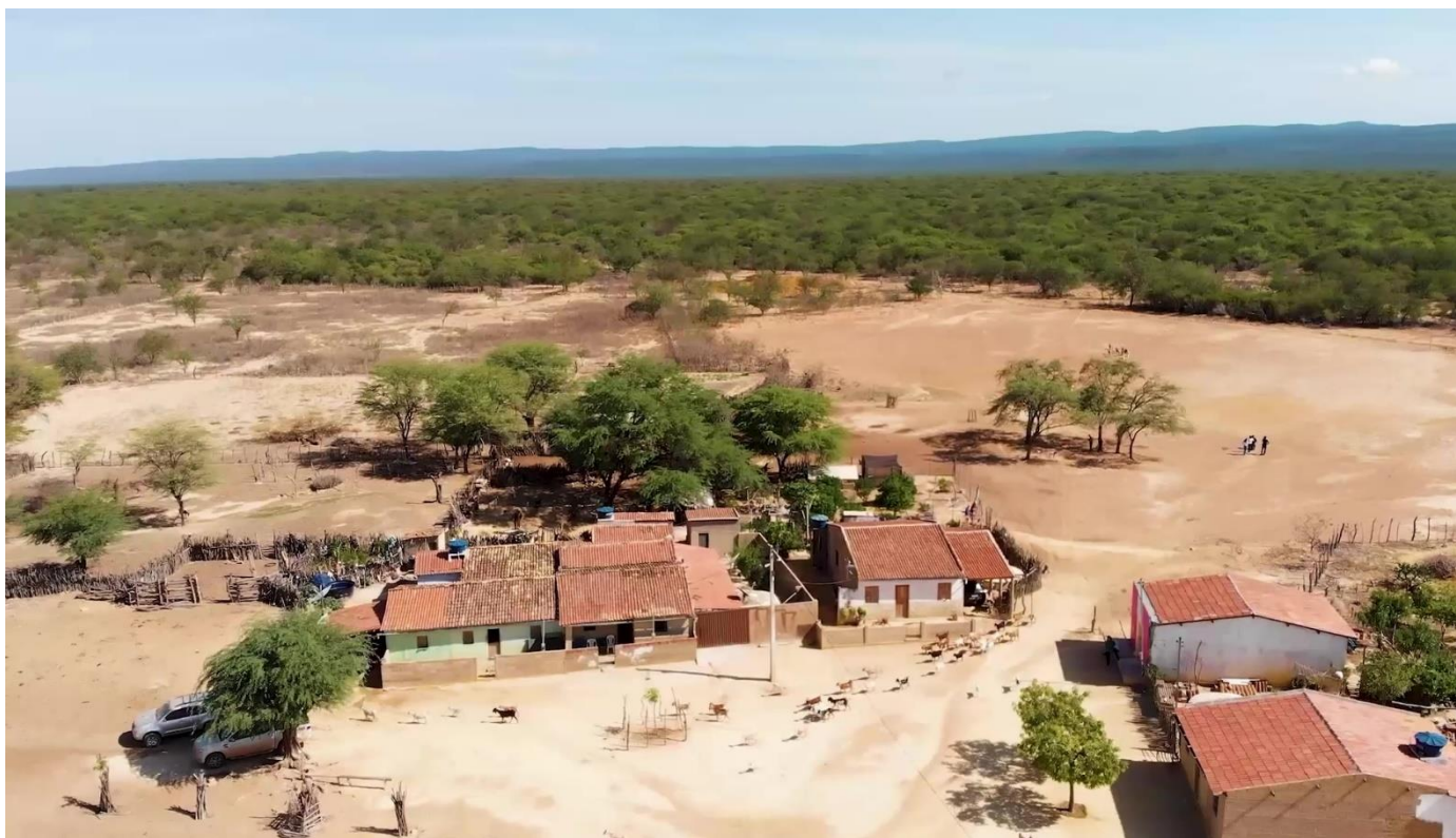
Imagen 1 Vista aérea de la Comunidad de Fartura, BA.

La comunidad de Fartura participó del proyecto piloto de Recaatingamento financiado por el Programa Petrobras Ambiental, que apoyó las primeras acciones del proyecto, cursos, talleres, la construcción de la unidad de procesamiento de umbú y el cercado del área destinada a la recuperación de la Caatinga. En una segunda etapa, el Instituto Interamericano de Cooperación para la Agricultura (IICA) y el Ministerio de Medio Ambiente (MMA) financiaron acciones sociales, ambientales y productivas vinculadas a la recuperación de las márgenes del arroyo Bazuá en la comunidad. Y, en la actualidad, el Proyecto Pro-Semiárido, una asociación entre el Gobierno del Estado de Bahía y el FIDA, está financiando la asesoría técnica continuada, ejecutada por el IRPAA. En los espacios de tiempo entre un proyecto y el otro, el IRPAA continuó trabajando junto a la comunidad con acciones de control, usando recursos de los proyectos con Cáritas y Misereor.