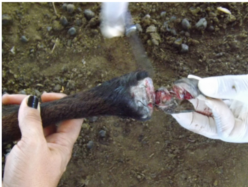
Animal em estágio avançado de Pododermatite, onde foi necessário amputar o pé inteiro.

de cobre a 15%. Para evitar essa doença os animais devem ficar em abrigos secos e higienizados, com passagem do animal em pedilúvio contendo solução de sulfato de cobre a 10%, ou formol a 10% ou cal virgem.