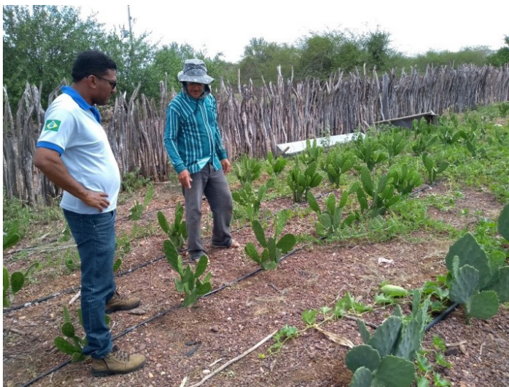
Plantio de leucena na comunidade quilombola Custaneira, Paquetá- PI.

Suplementação mineral - É uma prática de grande importância e que deve fazer parte de todo o ciclo produtivo de uma propriedade rural. Fatores como a raça, o sexo e a fase produtiva podem alterar as exigências minerais dos animais. A forma mais simples de