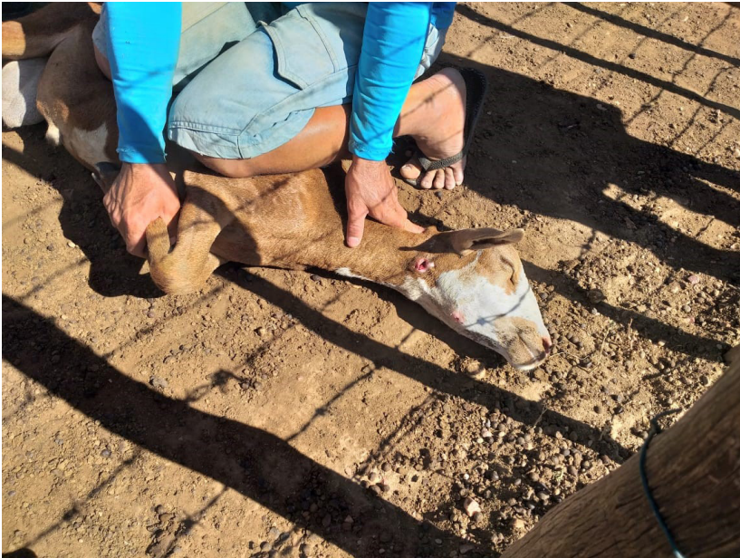
Extração de Linfadenite Caseosa, imagem cedida por Francisco Gildevan de Sousa.