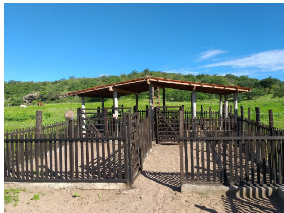
Foto 01. Aprisco com problema de excesso de esterco. Foto 02. Aprisco limpo a cada dois dias.