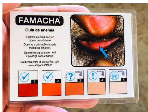
Cartão ilustrativo do método Famacha

Os sintomas mais comuns são: perda de peso, queda na produção de carne e leite, mucosa pálida (anemia), edema da região mandibular, pelos arrepiados e sem brilho, diarreia e desidratação. Para observar em quais situações é necessária a aplicação de medicamentos vermífugos, pode ser empregado o método Famacha®, que ajuda na indicação de diferentes níveis de anemia.